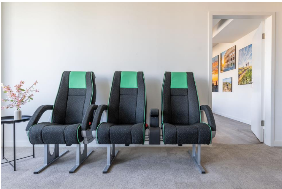
Platz nehmen und sich inspirieren lassen: Sitze der Königsklasse-Luxusbusse von Twerenbold Reisen bereiten Gästen in der Twerenbold Travel Lounge einen bequemen Empfang.