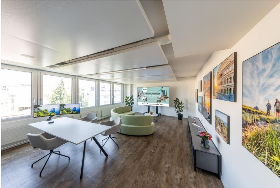
Im behaglichen Ambiente der Twerenbold Travel Lounge finden Reiseinteressierte ab sofort Inspiration und fachkundige Beratung zu den Angeboten der Twerenbold Reisen Gruppe.