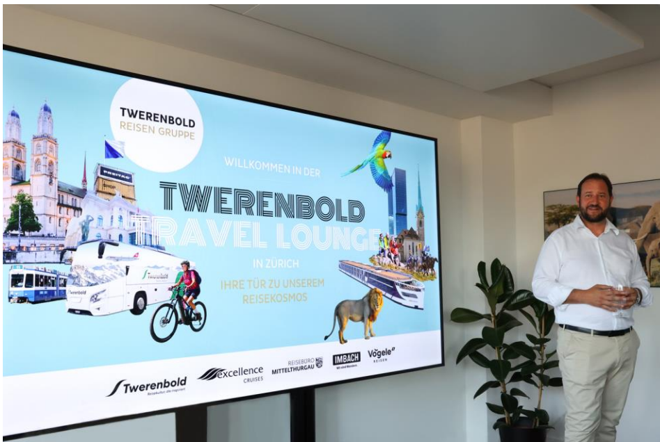
Karim Twerenbold eröffnete am 1. Juli 2025 mit einer Rede in feierlichem Rahmen in Anwesenheit von Gästen und Partnern die Twerenbold Travel Lounge.